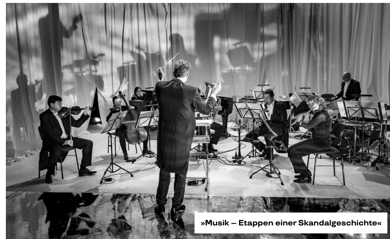
»Musik – Etappen einer Skandalgeschichte«

Empfohlen für Familien mit Kindern ab 5 Jahren