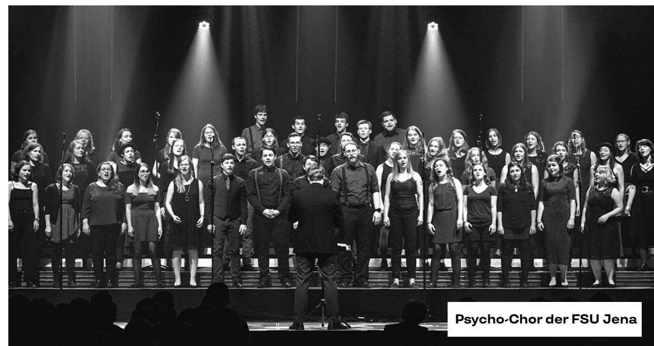
Psycho-Chor der FSU Jena