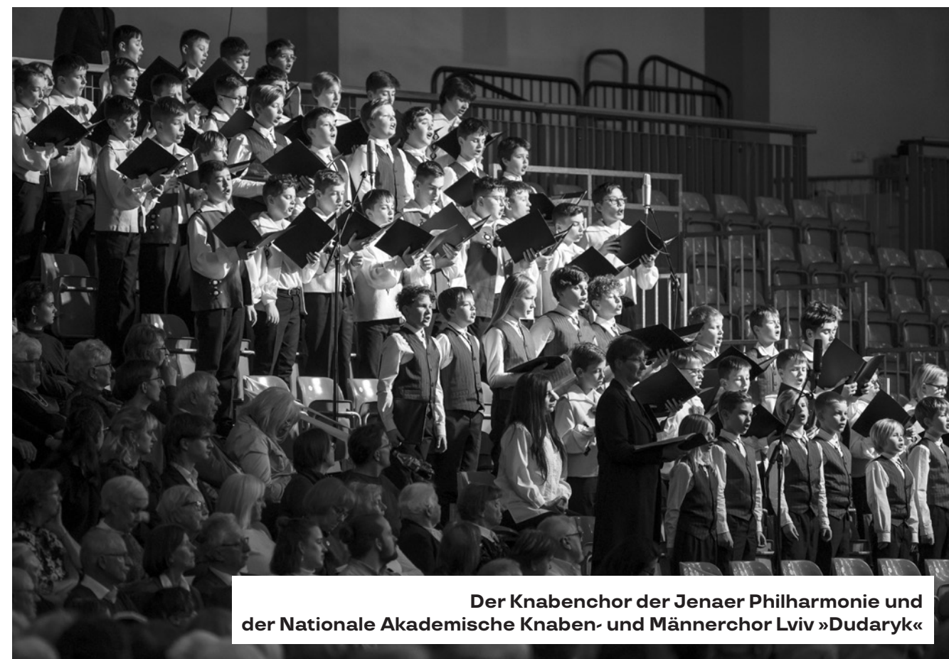
Der Knabenchor der Jenaer Philharmonie und der Nationale Akademische Knaben- und Männerchor Lviv »Dudaryk«