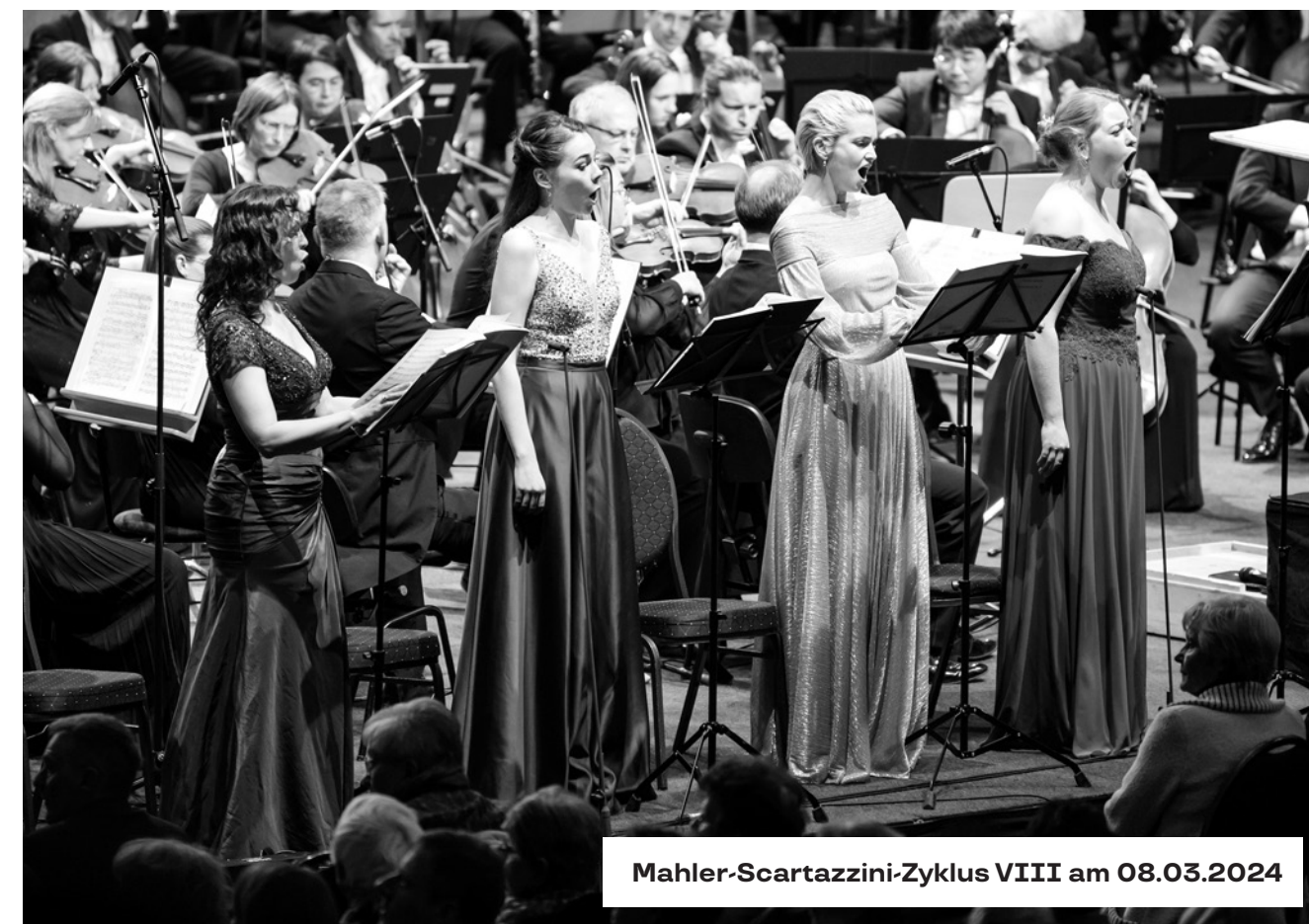
Mahler-Scartazzini-Zyklus VIII am 08.03.2024

Ein Überraschungsprogramm kuratiert von Musiker*innen der Jenaer Philharmonie